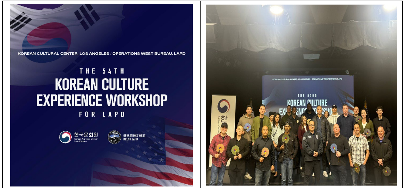
<(좌) 54 th LAPD Workshop 행사 포스터 / (우) 53 rd LAPD Workshop 자료사진, Feb 1 st , 2024>

- LA한국문화원, 4월 4일 LAPD 서부지역 본부(West Bureau)와 공동 개최 -