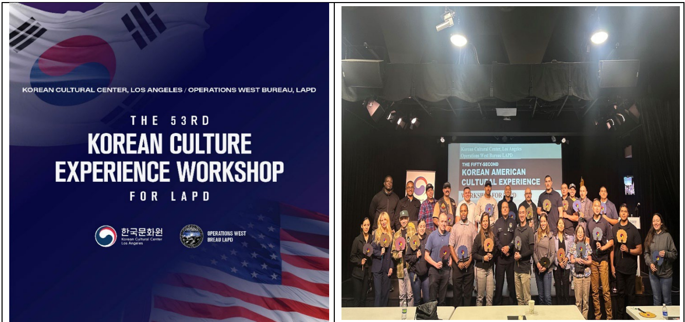
<(좌) 53 rd LAPD Workshop 행사 포스터 / (우) 52 nd LAPD Workshop 자료사진, Nov 2 nd 2023>

- LA 한국문화원, 2월 1일에 LAPD 서부지역 본부(West Bureau )와 공동 개최 -